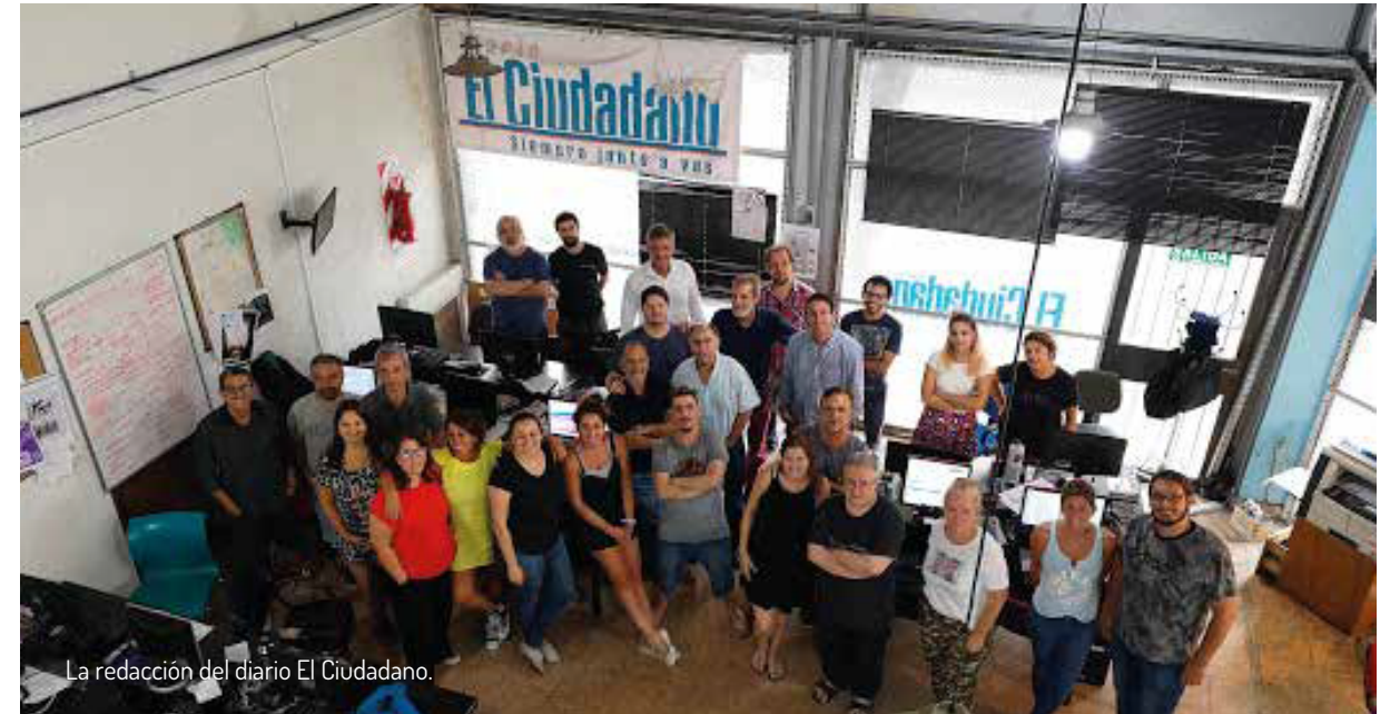
La redacción del diario El Ciudadano.

Además de las labores diarias para que el diario saliera a la calle, lo/as trabajadore/as tuvieron que aprender a organizarse para llevar adelante una empresa de iguales, transitando el camino hacia