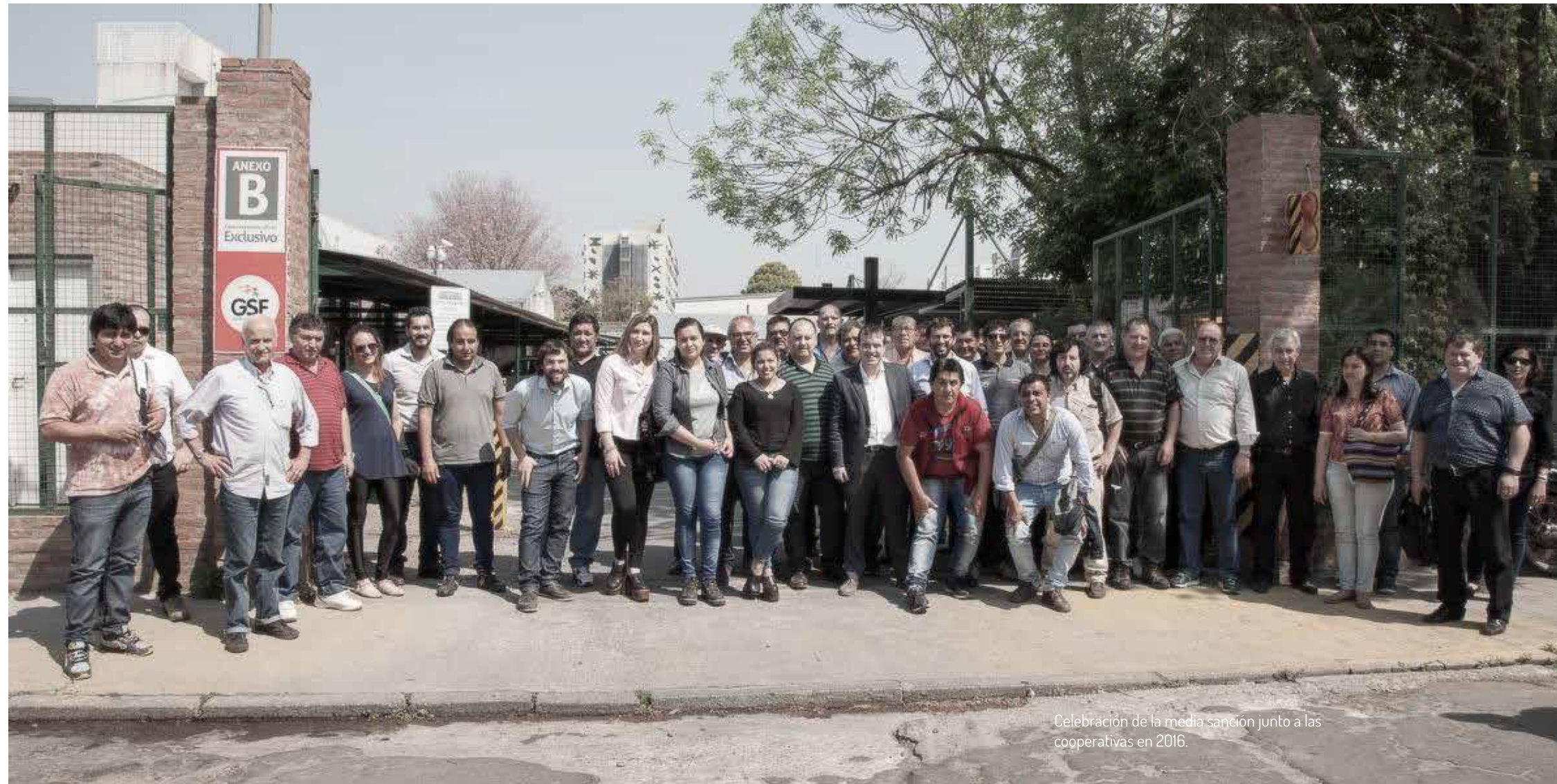
Celebración de la media sanción junto a las cooperativas en 2016.

En la tercera parte, se abordan algunas experiencias de Empresas Recuperadas santafesinas que abonaron el terreno para que fuera posible la ley, demostrando en casos concretos que la propuesta es viable y significa un gran avance a favor de lo/as trabajador/as. En estas experiencias se relata cómo, a partir de la mediación del Estado, es posible lograr acuerdos que permitan sostener la producción y el empleo frente al cierre de una empresa privada. Estos casos, entre otros, fueron los que expusieron la necesidad de tener una ley que garantice el acompañamiento del Estado, a través de un marco de abordaje específico, para facilitar las condiciones de creación de Empresas Recuperadas en toda la provincia.