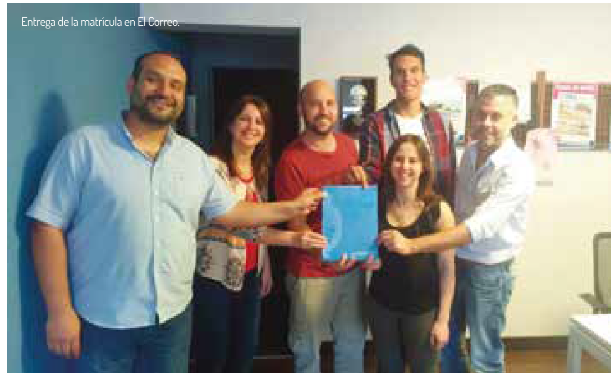
Entrega de la matrícula en El Correo.

Así lo/as trabajadore/as supieron construir un clima de trabajo donde lo que importa es la persona, buscaron ganar "calidad de vida" dando lugar a lo humano, donde el trabajo se organiza por objetivos y cada miembro sabe lo que tiene que hacer sin imposiciones ni impedimentos para el desarrollo de una vida personal y